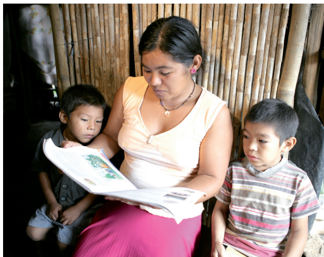
◀ Mère de famille participant à un cursus d'alphabétisation

Contribution de la Coopération luxembourgeoise : 13 400 000 EUR